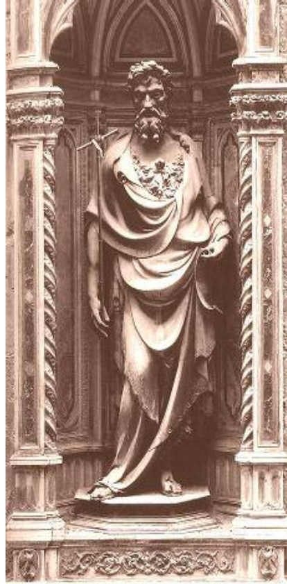
جیبرتیی Lorenzo Ghiberti

هونەری ئەوروپی سەدەکانی ناوەراستی و پێنسانس ٢٦٧